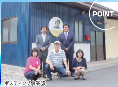
ポスティング事業部